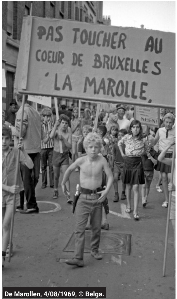
De Marollen, 4/08/1969, © Belga.

In juli 1969 ontvingen de bewoners van vijf huizenblokken in de Brusselse volkswijk Marollen een onteigeningsbevel. Meer dan 1500 personen riskeren hun woning te verliezen. De uitbreiding van het Justitiepaleis noopt de overheid tot afbraakwerken op een terrein van 1,5 hectare (met woningen die ze als “krotten” bestempelt). De regie der gebouwen leidt het project in goede banen voor rekening van het ministerie van Justitie (Chatelan, 2016).