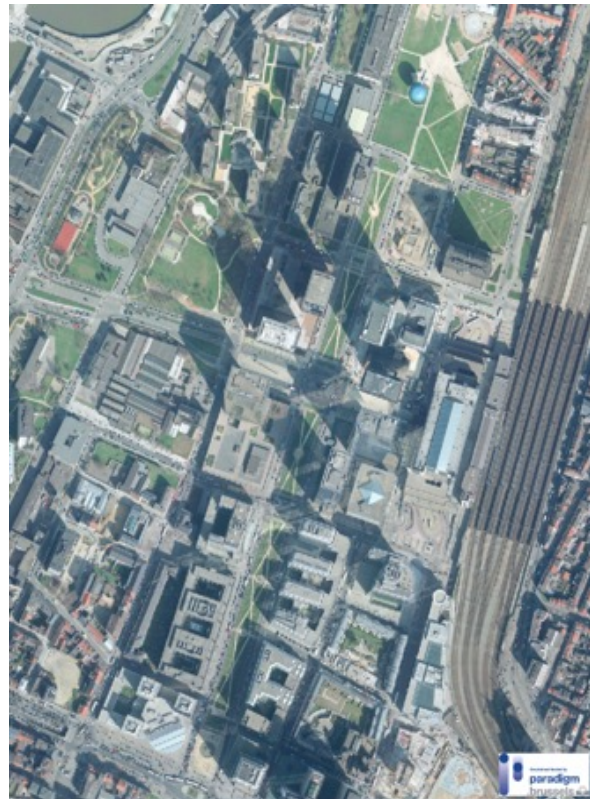
Noordwijk in 2004

Om de privésector mee te hebben moest het Manhattanproject voldoen aan drie vereisten: wetswijzigingen, onteigeningen (en herverkaveling) en valorisatie van onroerend goed en grond. In 1967 werden op vraag van de Belgische overheid drie Bijzondere Plannen van Aanleg (BPA) goedgekeurd, één voor elke gemeente: Brussel-Stad, Schaarbeek en Sint-Joost-ten-Node. Deze plannen wijzigden de bestemming van de gronden met als doel om deze gemengde en dichtbevolkte wijk om te vormen tot een functionalistische zakenwijk (Martens et al., 1975). Door deze nieuwe plannen stegen de huizenprijzen in de Noordwijk. Vanaf dan kunnen er kantoortorens worden gebouwd, een buitenkans voor de bouwpromotoren. Vervolgens ging de overheid, in naam van het «openbaar nut», over tot onteigeningen (vaak minnelijk, zonder vonnis) van de wijkbewoners. De bevoegde overheden voegden vervolgens de percelen samen tot grotere percelen, die werden verkocht aan privé-ontwikkelaars. De overheid heeft gezorgd voor een kader dat uiterst gunstig was voor de privésector: het zou voor ontwikkelaars en investeerders niet zo aantrekkelijk zijn geweest om de grond rechtstreeks van de plaatselijke bewoners te kopen. De toenmalige politieke en stedenbouwkundige visie op Brussel, en in het bijzonder op deze wijk, vormde de ideale voedingsbodem voor grondspeculatie en rent-seeking, de belangrijkste drijfveren van de investeerders (Van Criekingen, 2010).